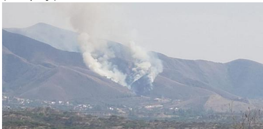
INCENDIO EN SAN ANDRES

https://elpais.bo/tarija/20210920_policia-bomberos-y-comunarios-atienden-incendio-de-magnitud-en-tarija-aseguran-que-no-hay-riesgo-para-las-viviendas.html